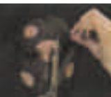
Katarzyna Kozyra (Polen / Poland) Olympia / Olimpia, 1996 National Museum in Krakow ©Katarzyna Kozyra